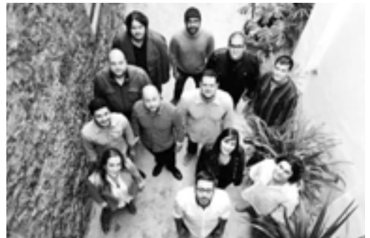
Los componentes de Canarias EnCanta. | LOT

Esta iniciativa, que es una idea de Partners Gestión Cultural, y cuenta con el apoyo de Gobierno de Canarias y Fundación Caja-Canarias, consiste en un concierto con el que se traza un recorrido fresco y actual por la música popular de Canarias con el fin de sensibilizar al público sobre el hecho cultural tradicional, familiarizándolo con los principales géne-