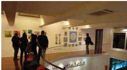
Imagen de la sala superior del Círculo de Bellas Artes.