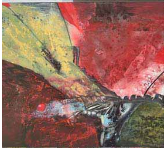
Detalle de uno de los cuadros de Ernesto Santana.

Horario: De lunes a viernes, de 17:30 a 20:00.